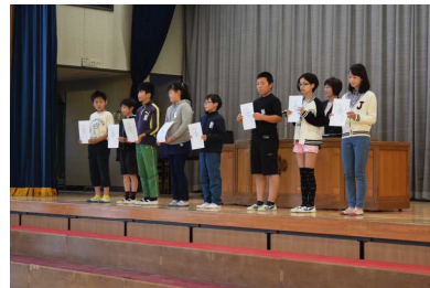
児童会役員認証状伝達式