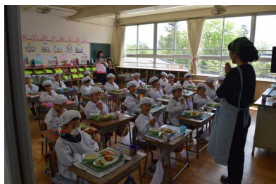
1年生 初めての給食

学年が協力しながら、プレゼントを作ったり、ゲームを考えたりしました。1年生へのプレゼントは校舎の形のペンダントで、校舎の中には校歌の歌詞が書いてありました。早く歌詞を覚えて、全校で校歌を歌いたいですね。