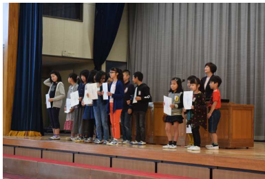
学級役員認証状伝達式