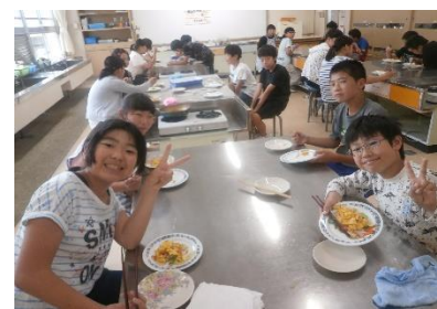
6年生 家庭科調理実習