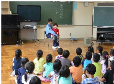
1年生 交通安全教室