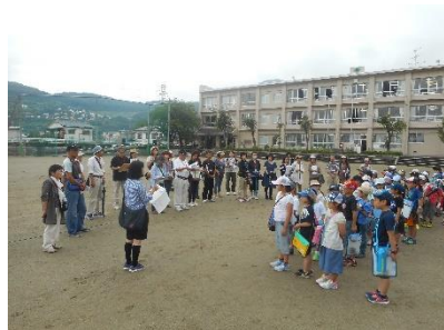
2年生 町探検サポーターの方、地域ボランティアの方と町探検へ