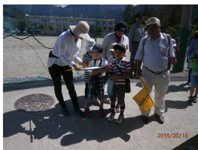
2年生 町探検サポーター、地域ボランティアの方と町探検へ