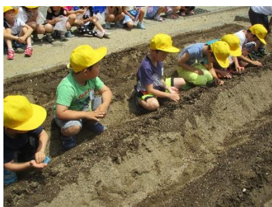
1年生 みんなで種まき