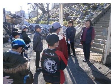
1月9日（木）地域の皆様と愛町奉仕作業