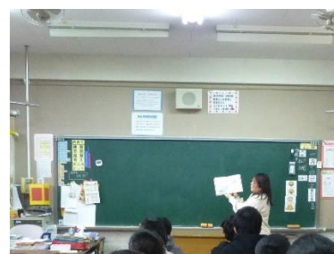
1月15日（水）読み聞かせボランティアの方々による「朝の読み聞かせ」の様子