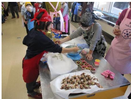
「里垣地区民生児童委員協議会」 「里垣こども広場」による バレンタインチョコ作り