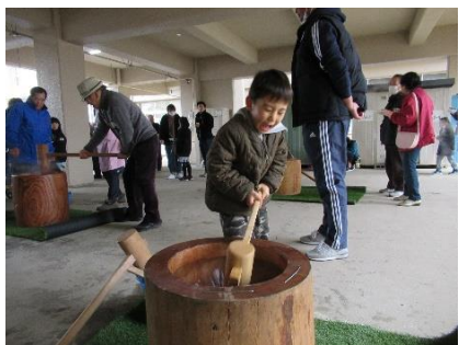
里垣地区 餅つきの様子