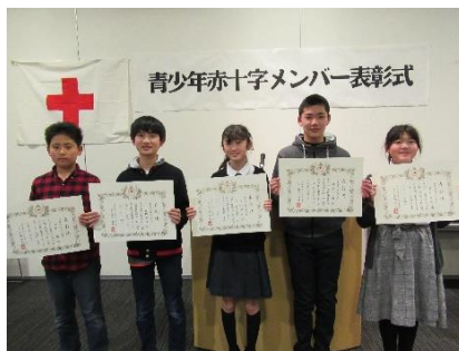
青少年赤十字メンバー表彰式